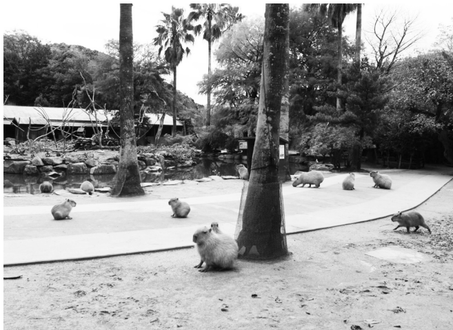
長崎バイオパーク カピバラ展示場 (エンリッチメント大賞2009大賞受賞)

エンリッチメントは、キーパー（飼育員）が来園者に見えないところも含めて取り組んでいる活動ですが、エンリッチメント大賞は、推薦から取材、発表といった一連の作業を市民活動としてオープンな形でやっています。ここで重要なのは、動物園側が自薦・他薦を含めて積極的にエンリッチメントの取り組みを情報発信していることです。推薦があった取り組みの中で、一次審査を通過した案件については、市民スタッフが現地取材などの情報収集をしています。その時も動物園がしっかりと情報提供してくれています。そうして確認できた情報を市民スタッフと私たち審査員が共有するからこそ、審査が成り立っているわけです。このようにして動物園のエンリッチメントの取り組みを顕彰できるのは素晴らしいことで、理想的な形だと考えております。