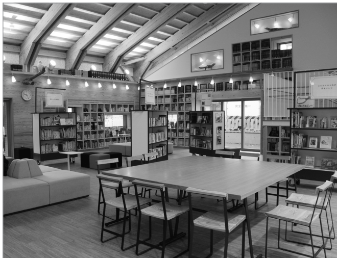
京都市動物園の図書室

残念ながら、日本では動物園はまだまだ子供のためという意識が強く、大人になっても動物園に夢中になる人は変わり者だと見られてしまいます。しかし、欧米の動物園には、日本よりも大人が多く来ています。これからは、日本の動物園も子供のためだけでなく取り組みをしていかなければいけません。その意味で、新しくできた京都市動物園の図書室は素晴らしいものです。動物園には、動物を見せるだけでなく、図書や映像や標本などいろいろな形で情報発信をしてもらって、子供だけでなく、多くの大人が学べる場になってほしいと願っております。