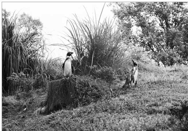
埼玉県こども動物自然公園のペンギンヒルズ