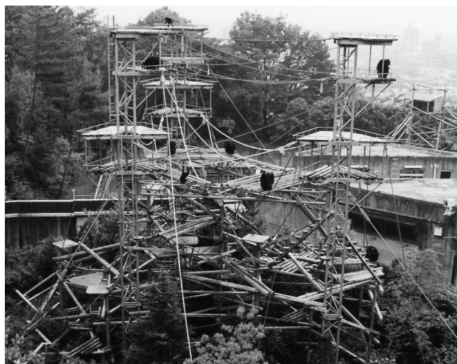
霊長類研究所のチンパンジーの運動場

私が「エンリッチメント」という言葉と出会ったのは1990年代の後半で、犬山にある京都大学霊長類研究所の松沢哲郎先生の研究室を訪問した時です。窓からチンパンジーの運動場が見えたのですが、そこに大きなタワーが建てられていて、地面には樹木が植えられていました。松沢先生