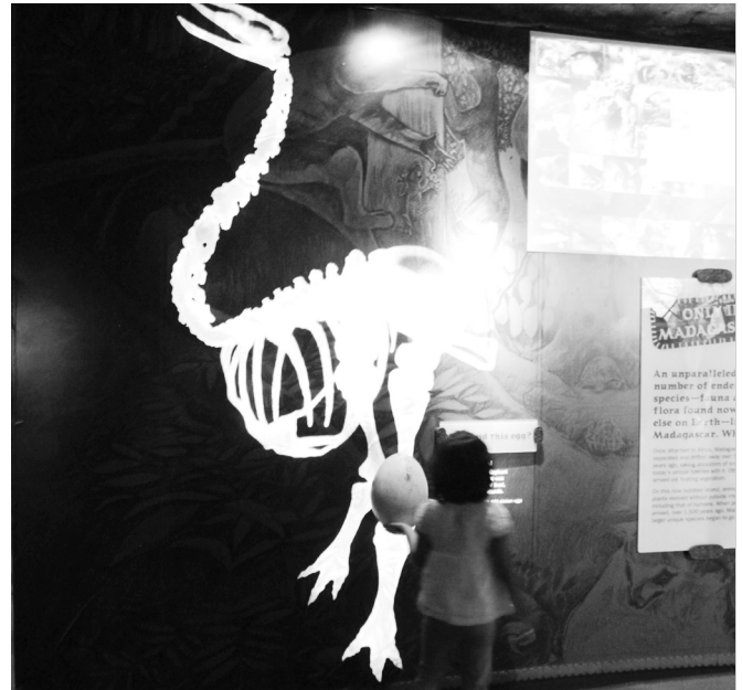
ブロンクス動物園「マダガスカル」展示のハンズオン 卵に触れると、絶滅したエビオルニススの骨格が浮かび上がる